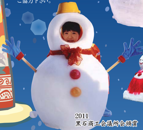
2011 黒石商工会議所会頭賞